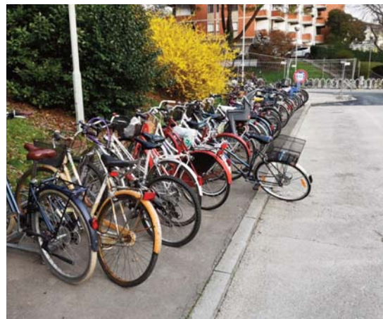
Il piazzale durante i lavori di sistemazione appena conclusi

Questo parcheggio, però, non dovrebbe limitarsi ad una semplice rastrelliera, possibilmente protetta dalle intemperie e illuminata nelle ore serali e notturne, ma dovrebbe rappresentare uno spazio curato, adeguato e dotato di una serie di servizi di base per chi si sposta sulle due ruote. Tra questi, ad esempio, una pompa, qualche attrezzo a disposizione per sistemare eventuali danni imprevisti e magari alcune prese elettriche dove poter ricaricare le bici a pedalata assistita. Poi, un pensiero a chi arriva da più lontano: «Sarebbe anche utile collocare dei cartelli che indichino la direzione per raggiungere il centro o altri luoghi importanti della città, e la ciclabile da seguire per i turisti che arrivano in treno con la bici al seguito»..... (Sintesi Marco Bisiach Il Piccolo 01/04/20)