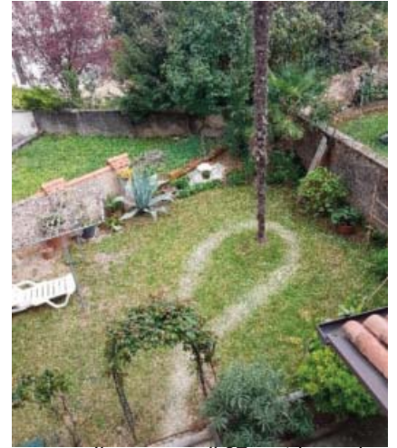
Il percorso di 37 metri ormai diventato una trincea