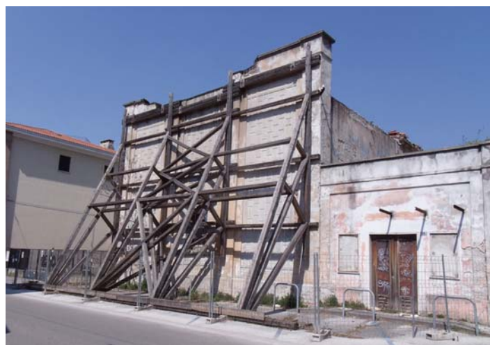
via Nizza– Ex Cinema Stella Mattutina