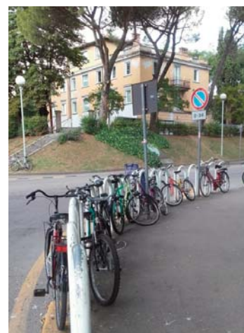
Il piazzale prima dei lavori di sistemazione