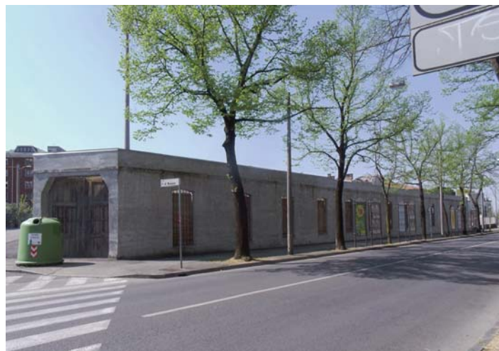
via Di Manzano – Ex Rimessa del tram

Nel centro città, esiste un' altro caso per il quale dovrebbe essere applicata tale procedura, anche se non si tratta di una proprietà comunale bensì della proprietà di un ente di interesse pubblico, e precisamente dell'ex sala della Stella mattutina di via Nizza, attualmente in stato di rudere, vistosamente puntellata. Vale la pena recuperare quell'edificio destinato a suo tempo a sala cinematografica? Oppure è preferibile recuperare l'area per parcheggi a disposizione degli impianti sportivi vicini esistenti o di altri servizi di interesse pubblico ai quali dovessero essere destinati gli edifici ricadenti nello stesso lotto di pertinenza? Fino a quando si dovranno ammirare le possenti puntellature, il tetto sfondato e le murature cadenti?