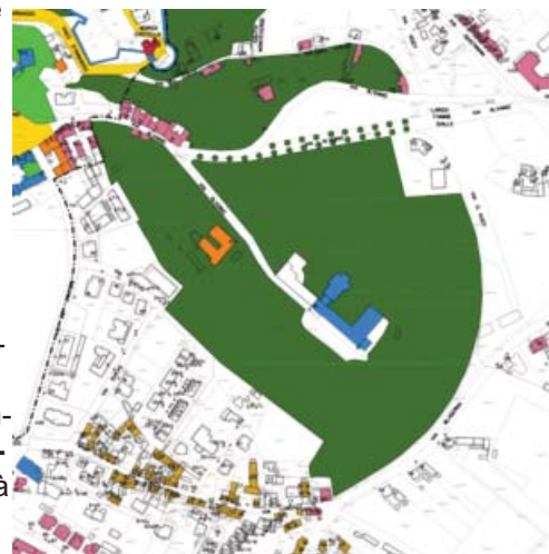
Terreni in via Alviano dell'ex Seminario, ora sede Università

Un esempio emblematico di quello che potrebbe avvenire nei nostri contesti urbani, nei quali le tradizionali funzioni urbane si stanno rarefacendo per motivi legati al calo demografico, ma anche alle diverse forme di comunicazione ed alle diverse modalità con le quali si possono svolgere le funzioni urbane mediante l'adozione sistematica delle nuove tecnologie. Il rinnovamento urbano, che non può essere sempre demandato soltanto all'iniziativa dell'Amministrazione pubblica, se potesse contare su nuove forme di rapporto tra utilizzatore degli immobili e proprietà degli stessi, potrebbe essere attuato con maggiore facilità ed in tempi ragionevoli, evitando che lo scenario delle nostre città sia disseminato di ruderi.