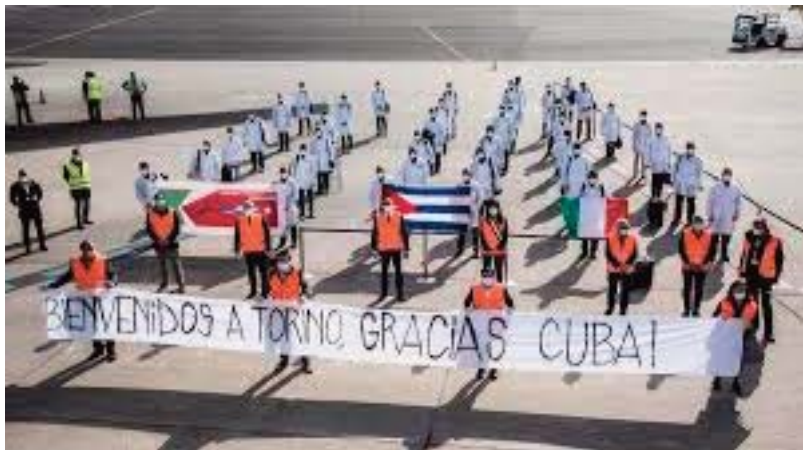
La Brigata cubana internazionale Henry Reeve in soccorso dell'Italia del Covid